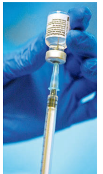
Das Impfen geht weiter voran. Die Jahrgänge 44 und 45 können sich anmelden.

Am Dienstag, 13. April, wurden im Bielefelder Impfzentrum 1634 Menschen geimpft. 782 bekamen den Wirkstoff Biontech zum ersten und 295 Menschen zum zweiten Mal. Erstimpfungen mit Astrazeneca gab es 557 und keine Zweitimpfung.