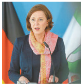
NRW-Schulministerin Yvonne Gebauer (FDP)

„Wir glauben, dass trotz eines dynamischen Infektionsgeschehens der Unterricht in Kleingruppen verantwortlich ist“, begründete